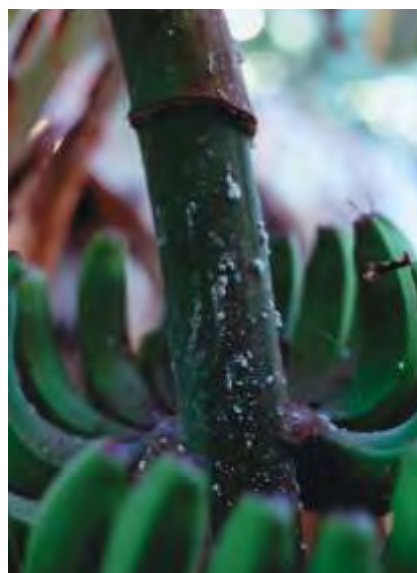
Cochinilla en racimo

El cuerpo de la hembra es oval y recubierto de una capa de cera blanca pulverulenta que le confiere un aspecto espolvoreado de harina. Desposeída de esta cera, su color varía desde un gris rosado a un rosa oscuro y su tamaño, también variable, puede alcanzar un máximo de 3 mm. La cochinilla algodonosa es móvil durante toda su vida porque posee tres pares de patas funcionales aunque sus movimientos son lentos sobre todo a partir de la puesta de huevos. Estos son de color anaranjado y depositados en ovisacos algodonosos blancos. Las hembras pasan por tres estados larvarios antes de formarse el adulto, los cuales sólo se diferencian en el tamaño. Los machos, muy pocos frecuentes, son alados.