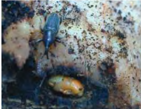
Adulto y pupa de picudo

apical, lo cual causa la muerte de las plantas. La mayoría de las galerías están situadas en la periferia del cormo, en la zona cortical.