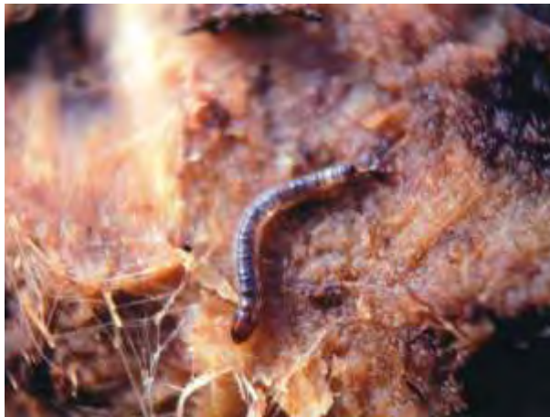
Larva de taladro

Las larvas son largas, de hasta 3 cm., con el cuerpo cilíndrico con un ligero estrechamiento justo después de la cabeza, de color blanco sucio con manchas oscuras en cada uno de los segmentos. La cabeza es marrón brillante.