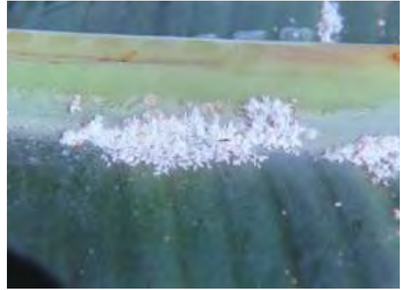
Diferentes estadios de lapilla en envés de la hoja